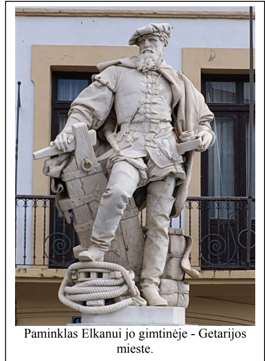
Paminklas Elkanui jo gimtinėje - Getarijos mieste.

Ispanai pigiai prisipirko tiek džiovintų gvazdikų, cinamono ir kitokių prieskonių, kad tapo aišku, jog viso krovinio nesugebės pargabenti Ispanijon. Juolab, kad prakiurusiam „Trinidad“ buvo reikalingas kapitalinis remontas. Nedelsiant išplaukti galėjo tik „Victoria“. Jos kapitonu buvo išrinktas Elkanas. 1521 metų gruodžio 21 dieną jis įsakė pakelti bures ir „Victoria“ su 44 europiečiais ir 13 vietinių gyventojų išplaukė Ispanijon, toliau sukdamas ratą aplink pasaulį, bet šį kartą jau per Portugalijos valdas.