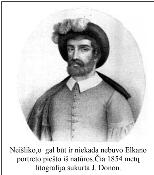
Neišliko, o gal būt ir niekada nebuvo Elcano portreto piešto iš natūros. Čia 1854 metų litografija sukurta J. Donon.

XVI a. Ispanijos karalius vienam savo pavaldiniui suteikė herbą su užrašu